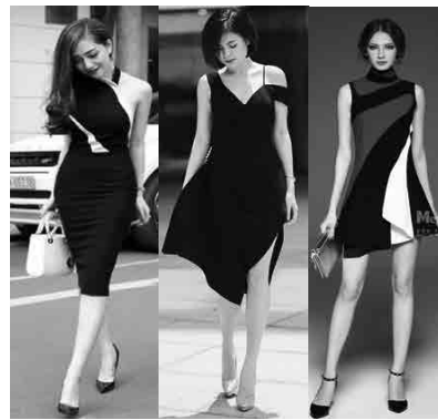
Hình 3. Xu hướng thời trang Việt Nam 2018 [4]

Ngày nay nhu cầu làm đẹp của giới trẻ không chỉ còn gói gọn nơi công sở hay ở buổi tiệc sang trọng, mà nhu cầu làm đẹp khi đi chơi, thậm chí là ở nhà được giới trẻ quan tâm hơn. Nắm bắt được nhu cầu đó, Thời trang luôn thay đổi để có phong cách thời trang đi chơi với kiểu dáng trẻ trung, năng động nhưng cũng không kém phần dịu dàng, nữ tính.