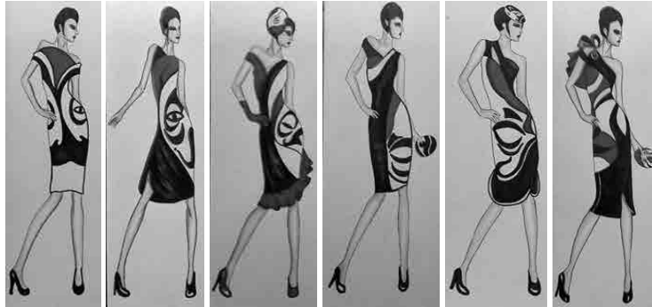
Hình 7. Hệ thống mẫu phác thảo phương án 1

Qua đó, đề tài đưa ra hai phương án thiết kế với kiểu dáng khác nhau nhưng vẫn tôn được nét đẹp văn hóa hiện đại và hợp với xu hướng thời trang của chủ đề.