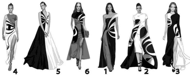
Hình 8. Hệ thống mẫu phác thảo phương án 2