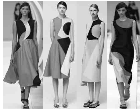
Hình 2. Mẫu thiết kế của Roksanda Ilincic [3]

Thế giới phát triển với giao lưu văn hóa, kinh tế và xã hội đa chiều, sự tự do và sáng tạo ngày càng không giới hạn. Vì vậy, xu hướng thời trang dạo phố 2018 chủ yếu sử dụng kỹ thuật ghép vải để tạo hình, qua các mảng màu, chất liệu kết hợp với nhau tạo lên một hình ảnh cá tính và năng động. Nhìn chung mỗi mẫu thiết kế mang lại những cảm hứng tươi mới và hấp dẫn dành cho xuân hè 2018. Hầu hết những mẫu thiết kế đều tôn lên khỏe khoắn, tươi trẻ cho người mặc.