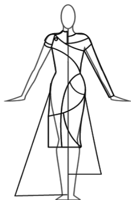
Hình 5. Kết cấu của bộ sưu tập

Kết cấu được xây dựng trên cơ sở kết quả nghiên cứu xu hướng trang phục. Phân tích rõ phom dáng, tỷ lệ, bố cục.